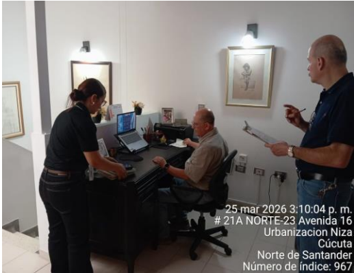
25 mar 2026 3:10:04 p. m. # 21A NORTE-23 Avenida 16 Urbanización Niza Cúcuta Norte de Santander Número de índice: 967