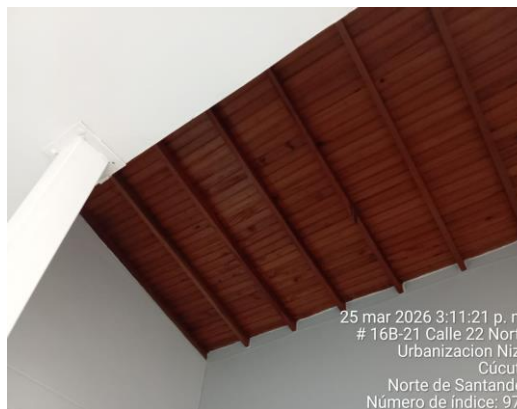
25 mar 2026 3:11:21 p. m. # 16B-21 Calle 22 Norte Urbanización Niza Cúcuta Norte de Santander Número de índice: 973