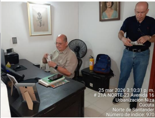
25 mar 2026 3:10:31 p. m. # 21A NORTE-23 Avenida 16 Urbanización Niza Cúcuta Norte de Santander Número de índice: 970