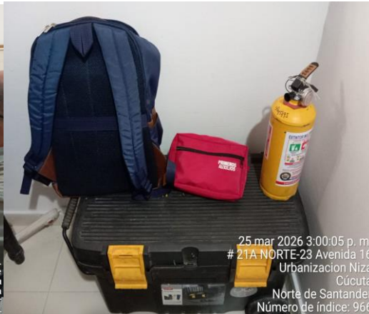
25 mar 2026 3:00:05 p. m. # 21A NORTE-23 Avenida 16 Urbanización Niza Cúcuta Norte de Santander Número de índice: 966