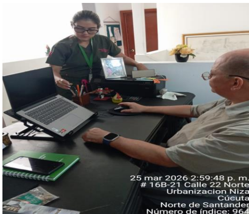
25 mar 2026 2:59:48 p. m. # 16B-21 Calle 22 Norte Urbanización Niza Cúcuta Norte de Santander Número de índice: 964