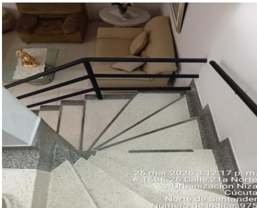
25 mar 2026 3:12:17 p. m. # 16B-26 Calle 21a Norte Urbanización Niza Cúcuta Norte de Santander Número de índice: 975